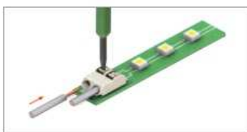
Кабель с многопроводной жилой вставляется после нажатия на фиксатор клеммы.