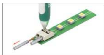
Любой кабель отсоединяется после нажатия на фиксатор клеммы.