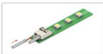
Кабель с однопроводной жилой вставляется без инструмента.

Клеммы считывателя позволяют производить быстрое подключение без отвертки. Вы можете использовать кабель с однопроводными или многопроводными жилами общим сечением от AWG24 (0,2мм 2 ) до AWG18 (0,82мм 2 ), например, КСПВ 8x0,5, стандартная витая пара CAT5.